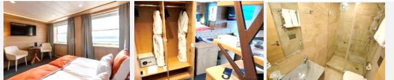
100- eines der beiden Fenster mit Blick auf die Außenleiter 101-116 - getrennte Betten können zusammengestellt werden.

Die ein-Zimmer-Kabine mit allem Komfort (Dusche, Badezimmer, Klimaanlage) ist für bis zu zwei Personen ausgelegt. In den Kabinen: Doppelbett, Kleiderschrank, Bademäntel, Telefon, Tresor, Kühlschrank, LCD-Fernseher, Haartrockner, Radio, zwei Fenster, Steckdosen für 220V. Tisch, Stühle. Wasser in Flaschen in der Kabine.