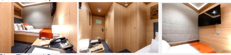
Ohne Tisch und Ottomane.

Die ein-Zimmer-Kabine mit allem Komfort (Dusche, Badezimmer, Klimaanlage) ist für eine Person ausgelegt. In den Kabinen: Einbetten, Kleiderschrank, Bademantel, Telefon, Tresor, Kühlschrank, LCD-Fernseher, Radio, Dusche, Klimaanlage, Haartrockner, Badezimmer, ein Fenster, Steckdosen 220V. Wasser in Flaschen in der Kabine.