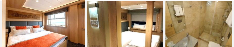
2 Panoramafenster lassen sich nicht öffnen. Doppelbett kann nicht auseinandergestellt werden. Säule vor dem Bett.

Die geräumige ein-Zimmer-Kabine mit Badezimmer (Dusche), Klimaanlage ist für bis zu zwei Personen ausgelegt. In den Kabinen: Doppelbett, Kleiderschrank, Bademäntel, Telefon, Tresor, Kühlschrank-Minibar, LCD-Fernseher, Haartrockner, Radio, zwei Fenster, Steckdosen für 220V. Tisch, Stühle. Wasser in Flaschen in der Kabine.