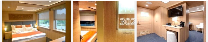
2 Panoramafenster lassen sich nicht öffnen. Badezimmer geteilt: Dusche und das separate WC. Das Doppelbett kann nicht auseinandergestellt werden

Die geräumige 1,5-Zimmer-Kabine mit Badezimmer (Dusche) und einem separaten WC, Klimaanlage ist für bis zu zwei Personen ausgelegt. In der Kabine: Doppelbett, Kleiderschrank, Bademäntel, Telefon, Tresor, Kühlschrank-Minibar, LCD-Fernseher, Haartrockner, Radio, zwei Fenster, Steckdosen für 220V. Tisch, Stühle. Wasser in Flaschen in der Kabine.