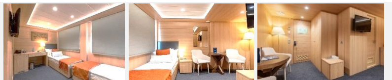
203, 204 - zwei Einzelbetten an den Fenster können nicht umgestellt werden.

Die ein-Zimmer-Kabine mit allem Komfort (Dusche, Badezimmer, Klimaanlage) ist für bis zu zwei Personen ausgelegt. In den Kabinen: zwei Einzelbetten, Kleiderschrank, Bademäntel, Telefon, Tresor, Kühlschrank, LCD-Fernseher, Haartrockner, Radio, zwei Fenster, Steckdosen für 220V. Tisch, Stühle. Wasser in Flaschen in der Kabine.