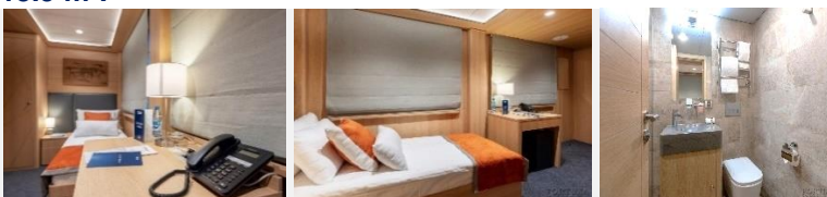
Ein Fenster mit Blick auf die Außenleiter.

Die ein-Zimmer-Kabine mit allem Komfort (Dusche, Badezimmer, Klimaanlage) ist für eine Person ausgelegt. In den Kabinen: Einzelbett, Kleiderschrank, Bademantel, Telefon, Tresor, Kühlschrank, LCD-Fernseher, Haartrockner, Radio, zwei Fenster, Steckdosen für 220V. Tisch, Stühle. Wasser in Flaschen in der Kabine.