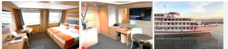
Getrennte Betten können zusammengestellt werden. Das erste Fenster geht auf die Seitenwand.

Die ein-Zimmer-Kabine mit allem Komfort (Dusche, Badezimmer, Klimaanlage) ist für bis zu zwei Personen ausgelegt. In den Kabinen: Doppelbett, Kleiderschrank, Bademäntel, Telefon, Tresor, Kühlschrank, LCD-Fernseher, Haartrockner, Radio, zwei Fenster, Steckdosen für 220V. Tisch, Stühle. Wasser in Flaschen in der Kabine.