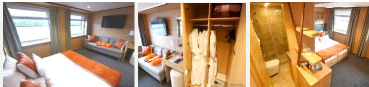
Sofa (nicht ausklappbar). Getrennte Betten können zusammengestellt werden.

Die ein-Zimmer-Kabine mit allem Komfort (Dusche, Badezimmer, Klimaanlage) ist für bis zu drei Personen ausgelegt. In den Kabinen: Doppelbett, Sofa, Kleiderschrank, Bademäntel, Telefon, Tresor, Kühlschrank, LCD-Fernseher, Haartrockner, Radio, zwei Fenster, Steckdosen für 220V. Wasser in Flaschen in der Kabine.