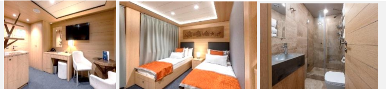
Einzelbetten können zusammengestellt werden.

Die ein-Zimmer-Kabine mit allem Komfort (Dusche, Badezimmer, Klimaanlage) ist für bis zu zwei Personen ausgelegt. In den Kabinen: zwei Einzelbetten, Kleiderschrank, Bademäntel, Telefon, Tresor, Kühlschrank, LCD-Fernseher, Haartrockner, Radio, zwei Fenster, Steckdosen für 220V. Tisch, Stühle. Wasser in Flaschen in der Kabine.