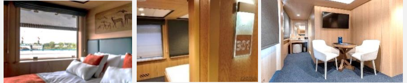
2 Panoramafenster lassen sich nicht öffnen. Das Doppelbett kann nicht auseinandergestellt werden.

Die geräumige ein-Zimmer-Kabine mit Badezimmer, Dusche, Klimaanlage ist für bis zu zwei Personen ausgelegt. In der Kabine: Doppelbett, Kleiderschrank, Bademäntel, Telefon, Tresor, Kühlschrank-Minibar, LCD-Fernseher, Haartrockner, Radio, zwei Fenster, Steckdosen für 220V. Tisch, Stühle. Wasser in Flaschen in der Kabine.