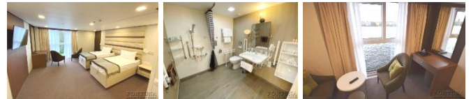
Einzelbetten (umstellbar). Zusätzlicher kostenpflichtiger Platz (Klappbett) möglich

Kabinen-Design. Umweltfreundliche Materialien, Designer-Möbel und Accessoires. Die Kabine mit Dusche ist für zwei + 1 Personen. In der Kabine sind zwei Einzelbetten, ein Kleiderschrank, ein Tisch, 2 Sofa, Bademäntel, ein Telefon, ein Safe, ein Kühlschrank, ein LCD-Fernseher, Klimaanlage, ein Haartrockner, ein Radio, Panoramafenster, Steckdosen für 220V. Die Kabine verfügt über einen Wasserkocher, eine Mini-Kaffeemaschine.