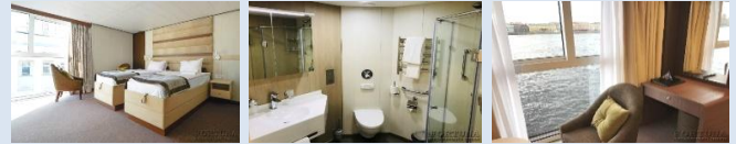
Einzelbetten (umstellbar). Zusätzlicher kostenpflichtiger Platz (Klappbett) möglich

Kabinen-Design. Umweltfreundliche Materialien, Designer-Möbel und Accessoires. Die Kabine mit Dusche ist für zwei + 1 Personen. In der Kabine sind ein Doppelbett oder zwei Einzelbetten, ein Kleiderschrank, ein Tisch, 2 Sesel, Bademäntel, ein Telefon, ein Safe, ein Kühlschrank, ein LCD-Fernseher, Klimaanlage, ein Haartrockner, ein Radio, Panoramafenster, Steckdosen für 220V. Die Kabine verfügt über einen Wasserkocher, eine Mini-Kaffeemaschine.