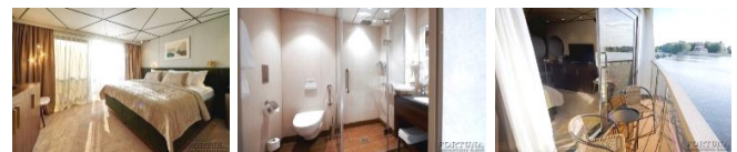
Fläche — 24 qm (die Fläche des Balkons Nr. 258 beträgt 6 m 2 , der Suite Nr. 259 4 m 2 )

Die Kabine mit Dusche ist für zwei Personen. In der Kabine sind ein Doppelbett, ein Kleiderschrank, ein Tisch, Stühle, Bademäntel, ein Telefon, ein Safe, ein Kühlschrank mit Minibar, ein LCD-Fernseher, eine Klimaanlage, ein Haartrockner, ein Radio, zwei Panoramafenster, Steckdosen für 220V. Die Kabine verfügt über einen Wasserkocher, eine Mini-Kaffeemaschine.