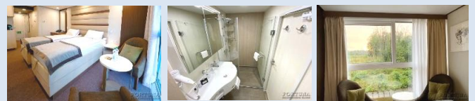
Einzelbetten (umstellbar). Zusätzlicher kostenpflichtiger Platz (Klappbett) möglich

Klimaanlage ist für zwei Personen. In der Kabine sind zwei Einzelbetten, ein Kleiderschrank, ein Tisch, zwei Sesel, Bademäntel, ein Telefon, ein Safe, ein Kühlschrank, ein LCD-Fernseher, ein Haartrockner, ein Radio, Panoramafenster, Steckdosen für 220V. Die Kabine verfügt über einen Wasserkocher, eine Mini-Kaffeemaschine.