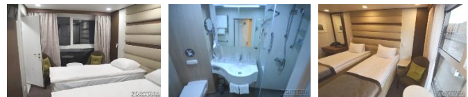
Einzelbetten (umstellbar). Zusätzlicher kostenpflichtiger Platz (Klappbett) möglich

Die Ein-Zimmer-Kabine Mit Dusche, Klimaanlage ist für zwei Personen. In der Kabine sind zwei Einzelbetten, ein Kleiderschrank, ein Tisch, zwei Sesel, Bademäntel, ein Telefon, ein Safe, ein Kühlschrank, ein LCD-Fernseher, ein Haartrockner, ein Radio, Panoramafenster, Steckdosen für 220V. Die Kabine verfügt über einen Wasserkocher, eine Mini-Kaffeemaschine. Zusätzliche Tür zur angrenzenden Kabine - kombinierbar zu 1 Kabine.