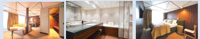
In der Kabine– Dusche und Badewanne (die Fläche des Balkons beträgt 10 m 2 )

mit Dusche und Badewanne, Klimaanlage ist für zwei Personen. In der Kabine sind ein Doppelbett, ein Kleideraum, Bademäntel, ein Telefon, ein Safe, ein Kühlschrank mit Minibar, ein LCD-Fernseher, ein Haartrockner, ein Radio, zwei Panoramafenster, Steckdosen für 220V. Die Kabine verfügt über einen Wasserkocher, eine Mini-Kaffeemaschine, einen Tisch, ein Sofa.