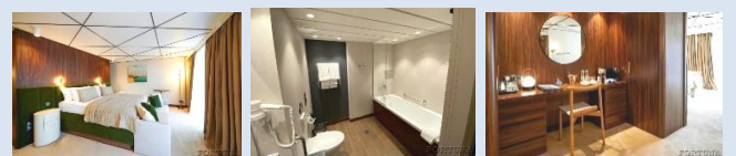
In der Kabine: Doppelbett, Sofa, Badewanne In der Kabine № 255 – Dusche

Kabinen-Design von Guido de Groot. Umweltfreundliche Materialien, Designer-Möbel und Accessoires. Die Kabine mit Dusche ist für zwei Personen. In der Kabine sind ein Doppelbett, ein Kleiderschrank, ein Tisch, Stühle, Sofa, Bademäntel, ein Telefon, ein Safe, ein Kühlschrank, ein LCD-Fernseher, eine Klimaanlage, ein Haartrockner, ein Radio, zwei Panoramafenster, Steckdosen für 220V. Die Kabine verfügt über einen Wasserkocher, eine Mini-Kaffeemaschine.