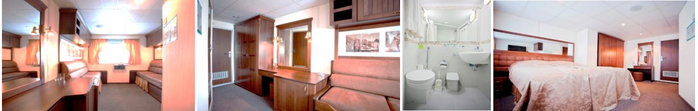
Ihr Komfortschiff MS „Wolga Star“ Kabinenbeschreibung

Die Wolga-Flusskreuzfahrt: St. Petersburg → Rostow am Don 11.09 – 24.09.2024 14 Tage / 13 Nächte Reiseroute: Russland Wolgareise St. Petersburg – Mandrogi – Kizhi – Goritsy – Jaroslawl – Nishnij Nowgorod – Tscheboksary – Kazan – Bolgar – Samara – Saratow – Wolgograd – Rostow am Don